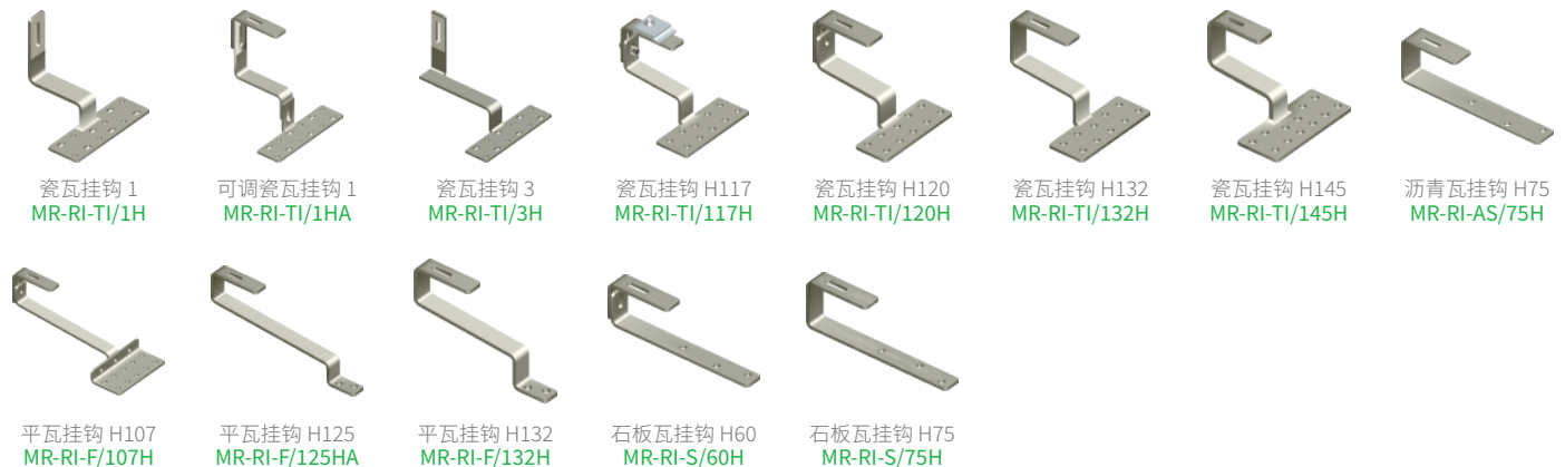
瓷瓦挂钩 1 MR-RI-TI/1H